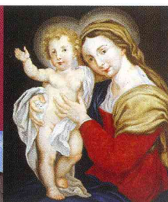
(Pro manuscriptu fuori commercio)

A servizio della Comunità Parrocchiale dal 1996